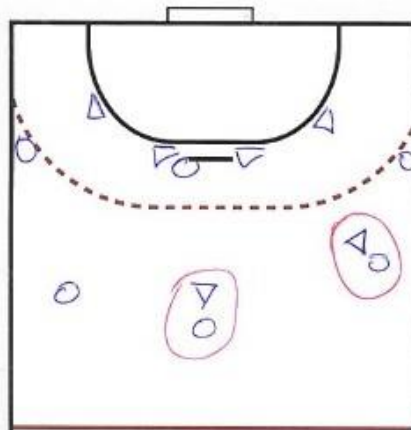
Obrázok 2 Kombinovaný obranný systém 2+4

Priestorové obranné systémy (0:6,1:5, 1:2:3, 3:3, 2:4) a osobná obrana (všetkých hráčov) je povolená.